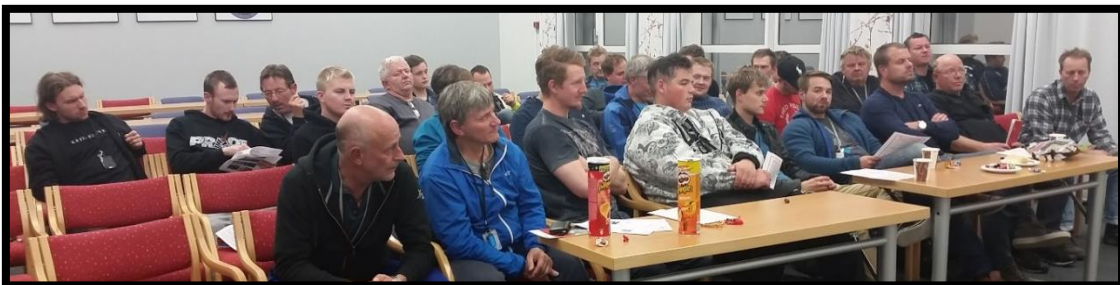
Medlemsmøte på kvelden

Diskusjonen for reisemontørene på land dreier seg hovedsakelig om rotasjonsordninger . På begge anleggene ble det jobbet 4-3, selv om reiseavstanden egentlig var for lang til at dette var gunstig.