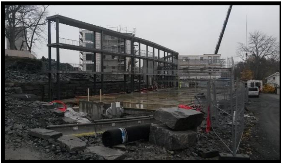
Munkvoll Gård, Buvik Elektro

Her er noen av anleggene vi har besøkt i oktober: